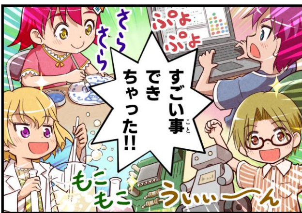
表紙イラスト・漫画 赤瀬よぐ